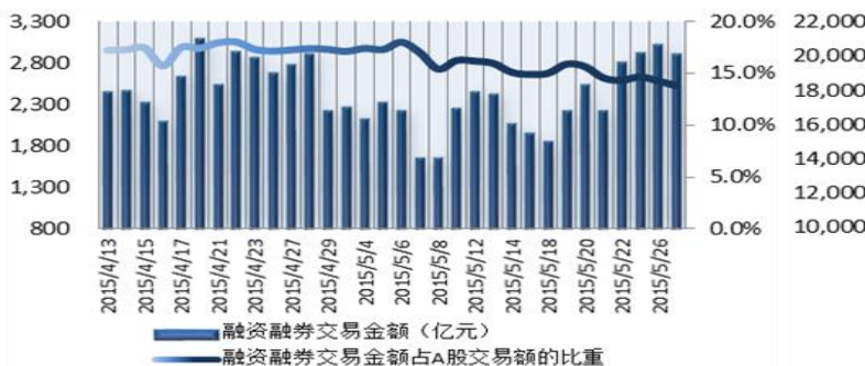
图1: 近三十个交易日融资融券交易金额及占A股交易额的比重